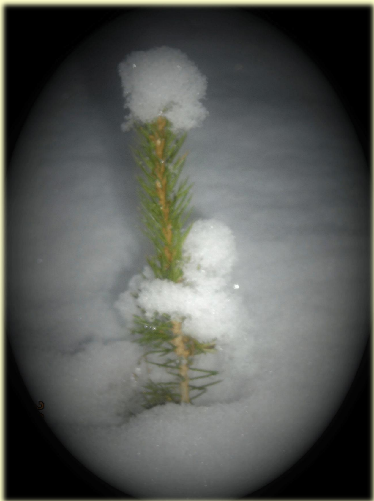
Pieni metsän enkeli halailee puuta...